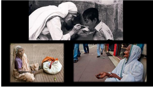
Obr. Matka Tereza a príbeh ženy